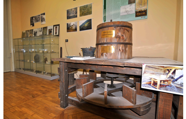
Museo delle Miniere presso Centro Culturale Massari

Percorso ad anello: partenza da Pieve Vergonte con visita al Museo delle Miniere della val Toppa 230 m, arrivo all'alpe Fontan m 796 luogo dove ha vissuto l'ultimo eremita della val d'Ossola e visita guidata della miniera. Pranzo panoramico con vista sulla piana del Toce . Al pomeriggio discesa a Fomarco con visita della Latteria turnaria ottimamente conservata, possibile tappa ristoratrice nel vicino circolo e ritorno a Pieve Vergonte.