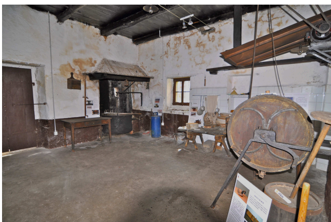
Latteria Turnaria di Fomarco